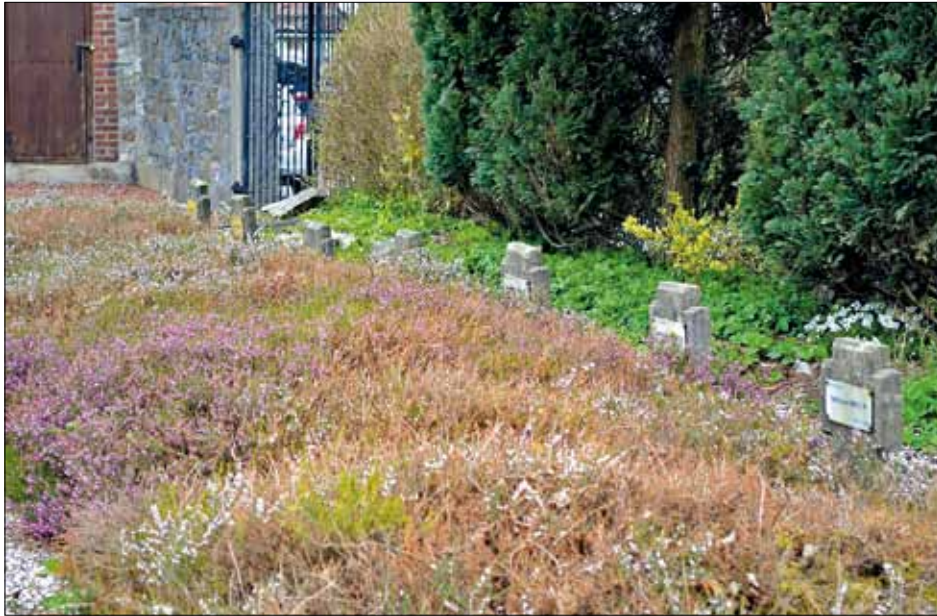
Abb. 2 Der kleine Friedhof / le petit cimetière

Heute wird die Kirche vornehmlich wegen ihrer um die Weihnachtszeit errichteten großen Krippe aufgesucht.