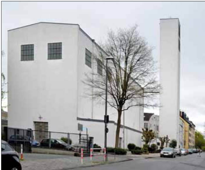
Abb. 5 Fronleichnamskirche Aachen / église de la Fête-Dieu à Aix-la-Chapelle

In dem Zusammenhang sollte auch der andere Architekt, nämlich Rudolf Schwarz, nicht unerwähnt bleiben, der von 1927 bis 1934 Leiter der Aachener Kunstgewerbeschule war und der etwa um die gleiche Zeit in Aachen die Fronleichnamskirche entwarf (Abb. 5).