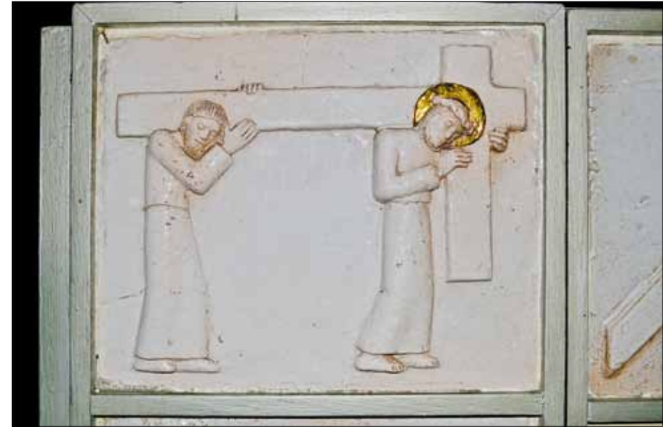
Abb. 3 Tabernakel Detail / tabernacle détail

La chapelle du couvent des franciscains du Garnstock a été construite entre 1934 et 1936 par l'architecte Dominikus Böhm. Cet édifice se caractérise essentiellement par une étroite collaboration entre l'architecte, qui « construit ce qu'il croit » et les différents artisans, tous anciens élèves de la Kunstgewerbeschule d'Aix-la-Chapelle. Ainsi est créé un espace sobre dans lequel quelques éléments décoratifs beaux et discrets ne distraient même pas de l'essentiel.