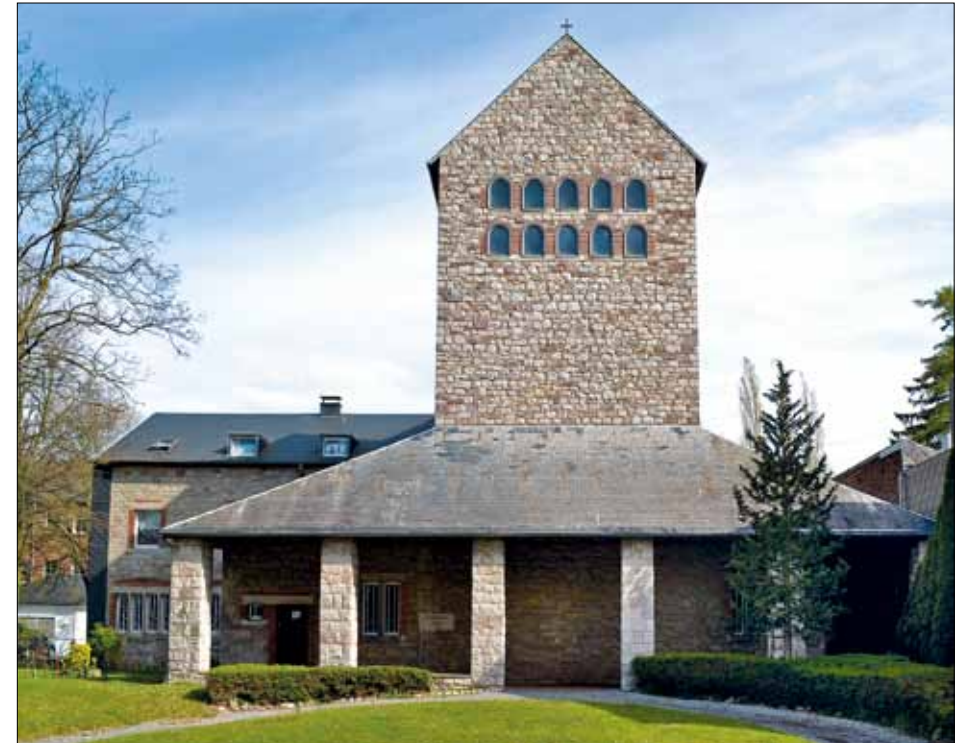
Abb. 1 Franziskanerkloster Garnstock / monastère franciscain au Garnstock

Die Kirche des Franziskanerklosters Garnstock wurde zwischen 1934 und 1936 nach Plänen des Architekten Dominikus Böhm errichtet. Das Kloster diente als Ausbildungsstätte für die Evangelisierung in Südbrasilien.